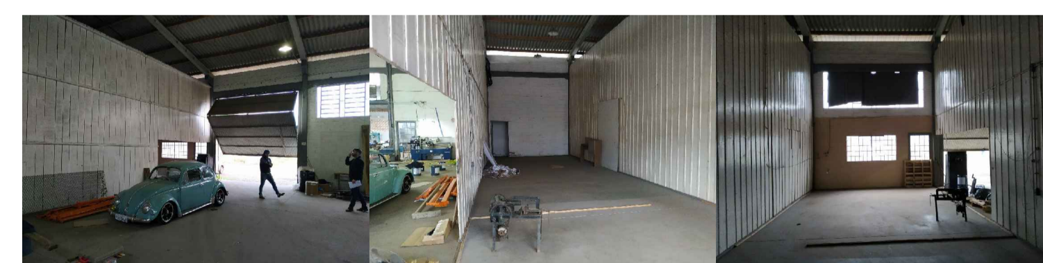
Remoção de Paredes de madeira