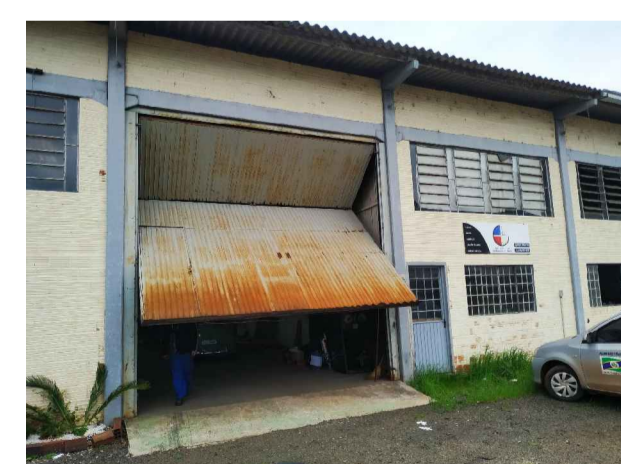
Reforma de esquadrias metálicas