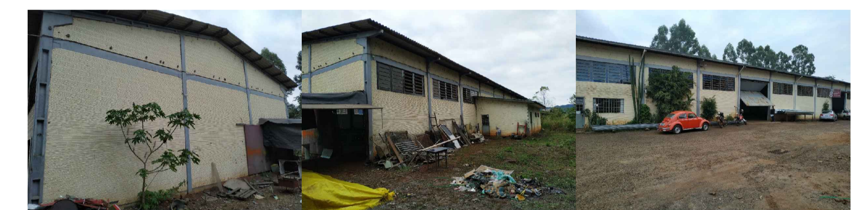
Limpeza e pintura interna/externa/piso