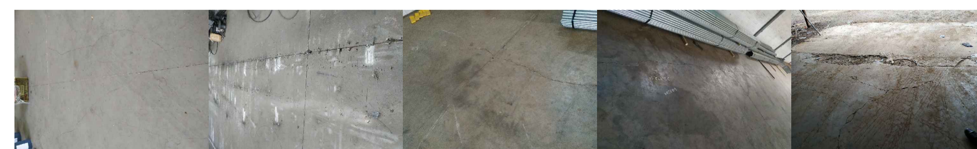
Correção de Pisos (recorte + argamassa + pintura)